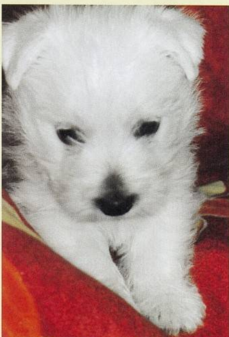
Zdanie plyšového medvedíka klame.

rovnako ako zlou úpravou možno zničiť aj nádherné zviera. Kvalitne upravovaného westa stačí vyčesať 1 × za týždeň. Kúpať westíka v šampóne treba len minimálne, najlepšie vôbec. Po prechádzke v mokrom počasí stačí osprchovať bruško a labky čistou vodou bez šampónu či mydla. Vyčistiť kožušok westíka možno aj na sucho – vhodný je Solamyl – zemiacový škrob, môže byť zmiešaný s kriedou