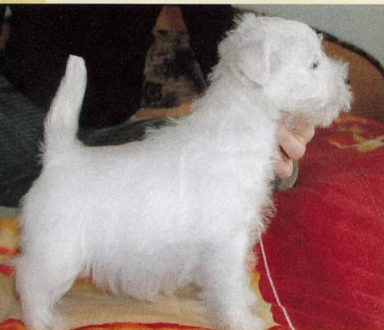
Buxley SUNSHINE CELEBRATION, 7 týždňov.

chej kože, ktorú však aj ten najkvalitnejší šampón ešte viac vysušuje. Vy sa takto v snahe riadne sa o westíka starať, zamotávate do ešte väčších problémov, a to kožných. Pritom stačí väčšinou venovať pozornosť už spomínaným ŠPECIFIKÁM. Ak chcete svojho psa každý týždeň kúpať, ak ho chcete strihať, a nie trimovať, nezaobstarávajte si westa. V opačnom prípade aj tak nedosiahnete žiadany efekt – typického predstaviteľa plemena.