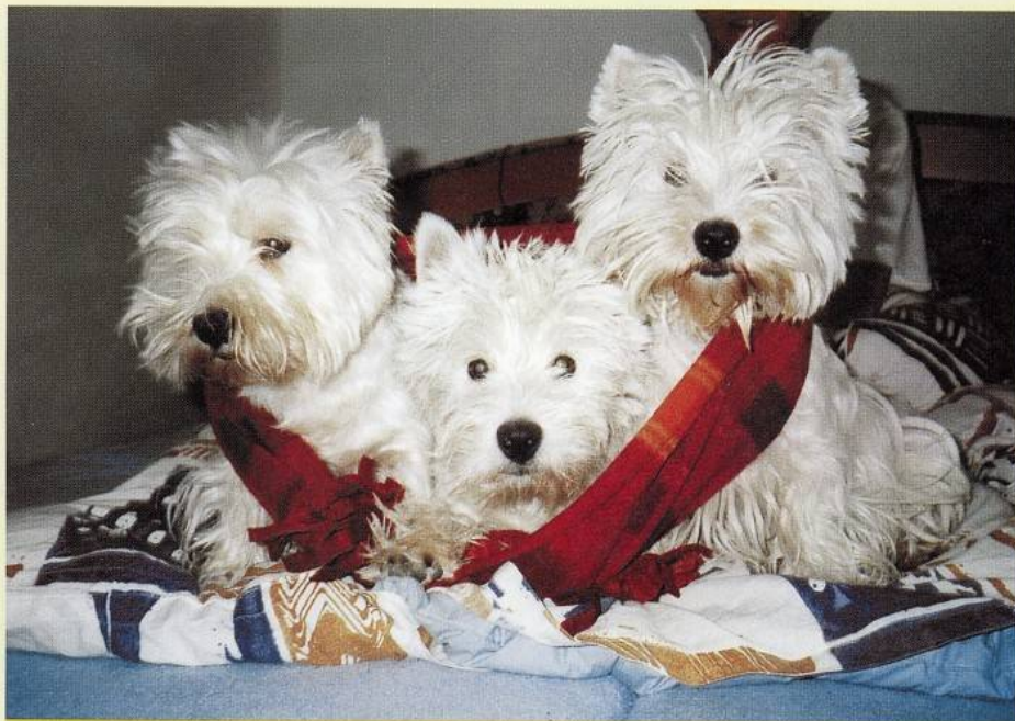
Vo svorke je všetko zábavnejšie.

dujte sa preto, keď váš westík nie je biely ako čisto napadnutý sneh a nehádzte ho hneď do vane. Na druhej strane nie je v poriadku, ak sa srst' zafarbuje do červena, do hnedá či do siva, môže ísť aj o kožné ochorenie spôsobené najmä nesprávnou úpravou.