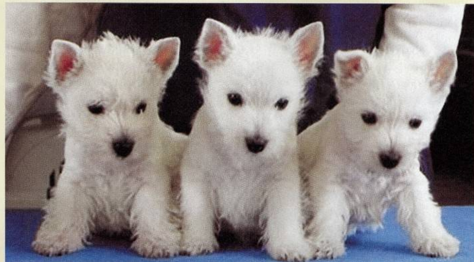
2-mesačné šteňatá z vrhu „B“ z chovateľskej stanice SUNNY SIDE – BUBBLE, BARNEY a BUFFY.