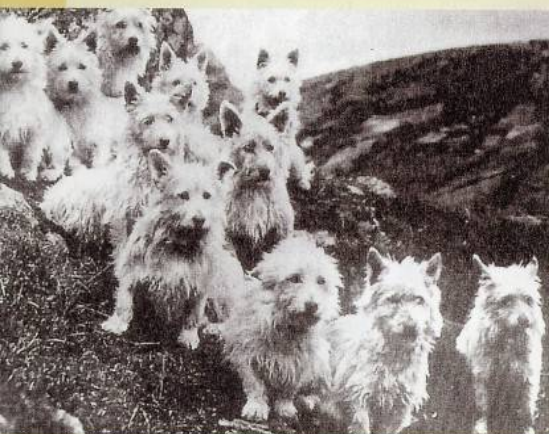
Tak takto vyzerali westíkovia niekedy.

West highland white teriér alebo skrátene westík (v slovenčine biely teriér zo Západnej vysočiny) je malé temperamentné plemeno. Patrí do III. skupiny FCI plemien psov, teda medzi teriéry. Výška v kohútiku je okolo 28 cm. Pre typický westovský výraz sú charakteristické tri čierne body na hlave – oči a ňufáčik, preto je na nich žiadaný sýtočierny pigment. Ako hovorí štandard plemena, ide o malého, pohyblivého, hravého, ale tiež