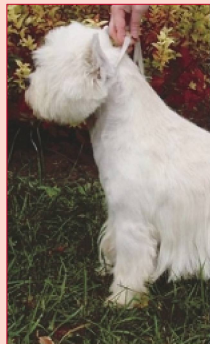
MultiCH. Un Pour Moi du Moulin de Mac Gregor, ch. Ruth