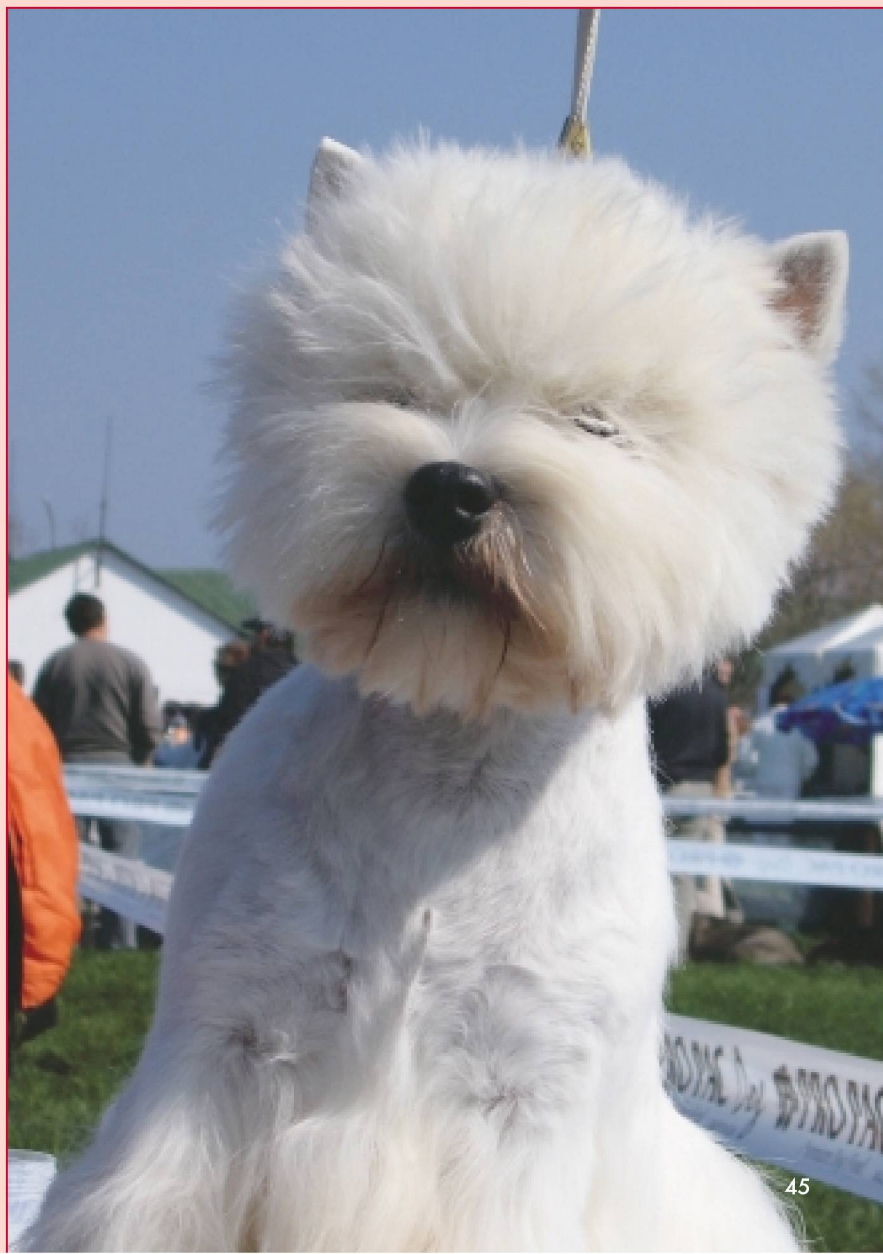
MultiCH. Un Pour Moi du Moulin de Mac Gregor, ch. Ruth O' Connor, m. Mgr. Martina Krišová - ICH., TOP TERRIER 2005, TOP WHWT 2004 + 2005, CH. FIN - HU - PL - CZ - SK - CROA - SKCHTaF, GCH. HU - SK, Show CH. HU, 30 x BOB, 4x BOG, J. BIS, CACIB zo 6 krajín, KV SKCHTaF 2005, KV Slovín. Klubu ter. 2005, JCH. CZ - SK - PL - SKCHTaF

Nespoliehajte sa nikdy na výhradne mailový, alebo telefonický kontakt s chovateľom, ne-súhlaste s dovezením šteniatka.